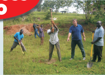
März 2007: der erste Spatenstich ...

Aktuelle Fotos und auch weiterhin aktuelle Infos unter www.akjs.eu