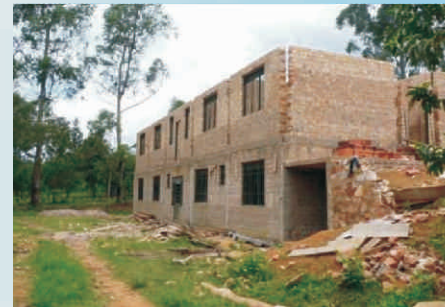
September 2007: das erste Stockwerk steht ...