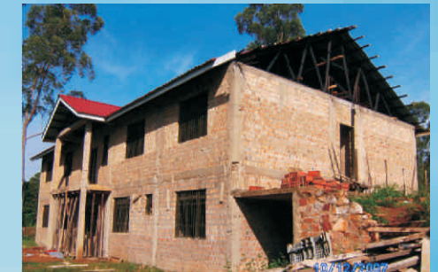
Dezember 2007: das Dach ist drauf ...