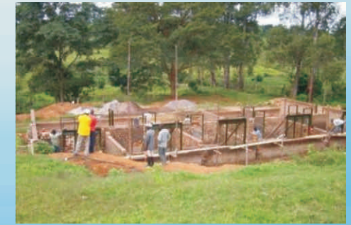
Mai 2007: das Erdgeschoss wächst ...